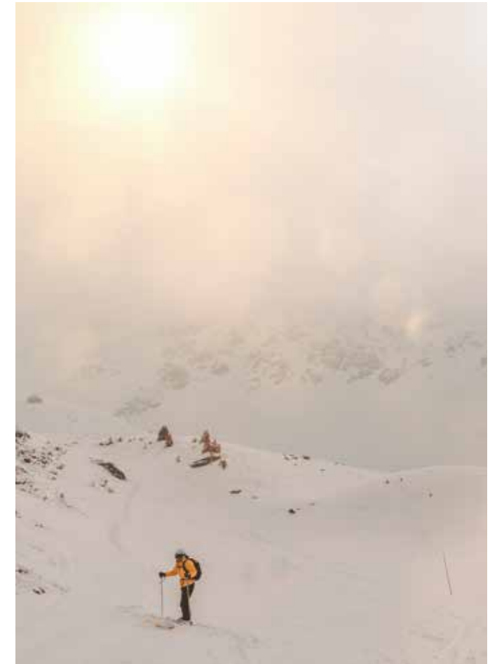
Toppturer på skidor utanför pisterna, så kallad ski touring, har blivit allt populärare bland avancerade skidåkare högt uppe i Alperna.

Resten av dagen ägnas åt byvandringar. Saint-Luc med sina vackert kombinerade trä- och stenhus är från 1200-talet, men har eldhärjats ett flertal gånger. Hela Val d'Anniviers kännetecknas av de här omgivningarna, historiskt sett lika brandfarliga som skönt patinerade. Vykortsvackra Grimentz är faktiskt den enda byn som helt klarat sig undan elden genom alla sekler, och det är också här man för första gången ser asiatiska turister hoppa av lokalbussen från Sierre. Så känns Grimentz som själva sinnebilden av den tidlösa schweiziska bergsbyn.