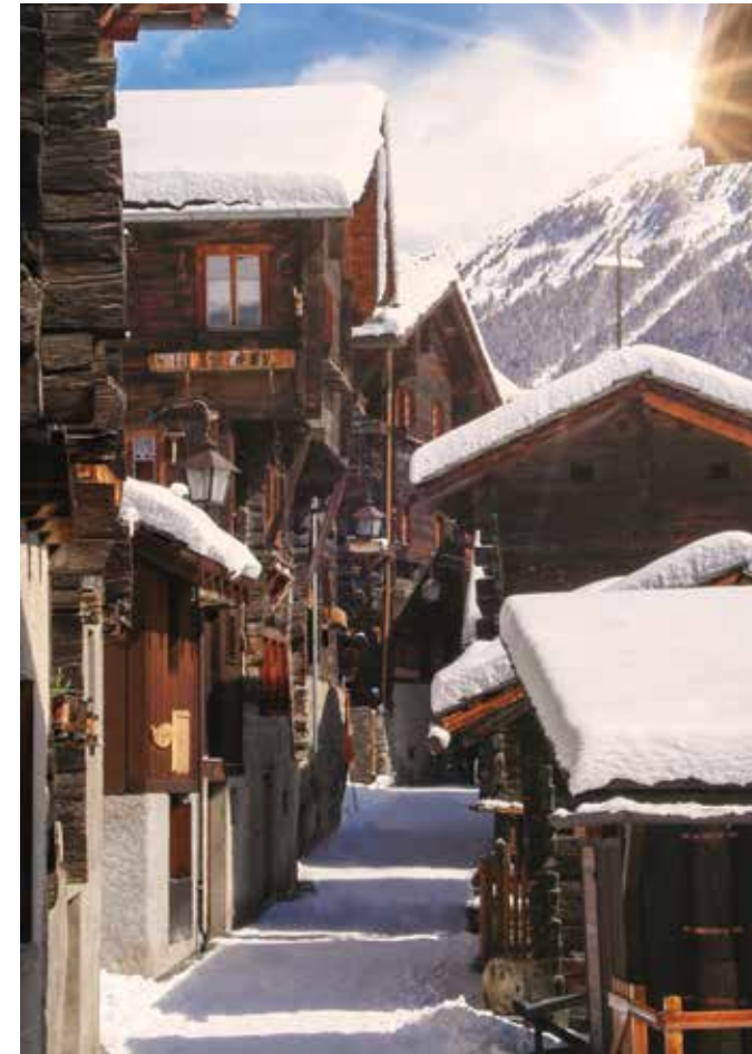
Den orörda, mångsekelgamla träarkitekturen har gjort alpidyllen Grimentz till en av landets mest berömda höghöjdsbyar.