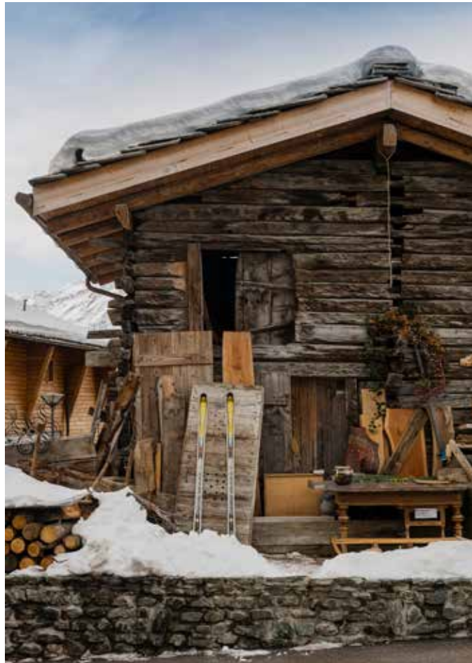
Vackert patinerade trähus med karaktäristiska skiffertak är typiska för trakten i Val d'Anniviers.