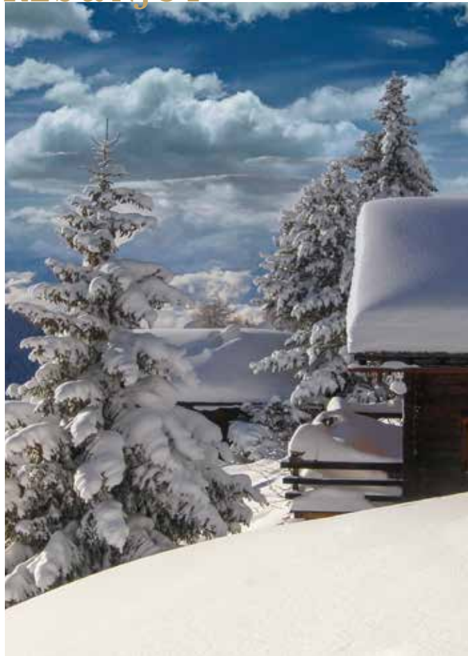
Vintern blir inte vackrare än detta inbjudande och inbäddade landskap som möter besökaren runt byn Chandolin.